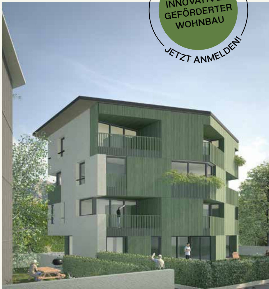
Das Rendering zeigt den Bebauungsvorschlag für das geförderte Mehrfamilienhaus.